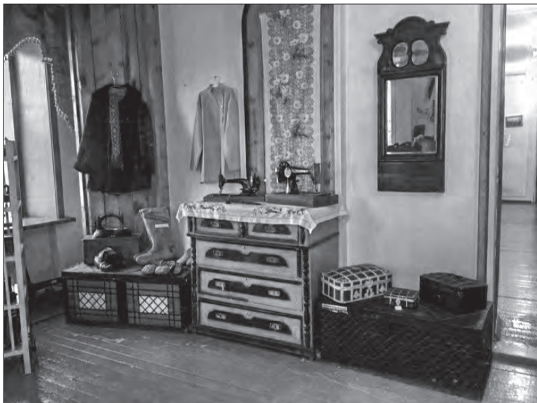
Историко-краеведческий музей им. Н. В. Перетолчина

Областной конкурс «Лучшие сельские учреждения культуры и их работники» проводится уже 7 лет. Его цель — поддержать муниципальные учреждения культуры, расположенные на территории сельских поселений.