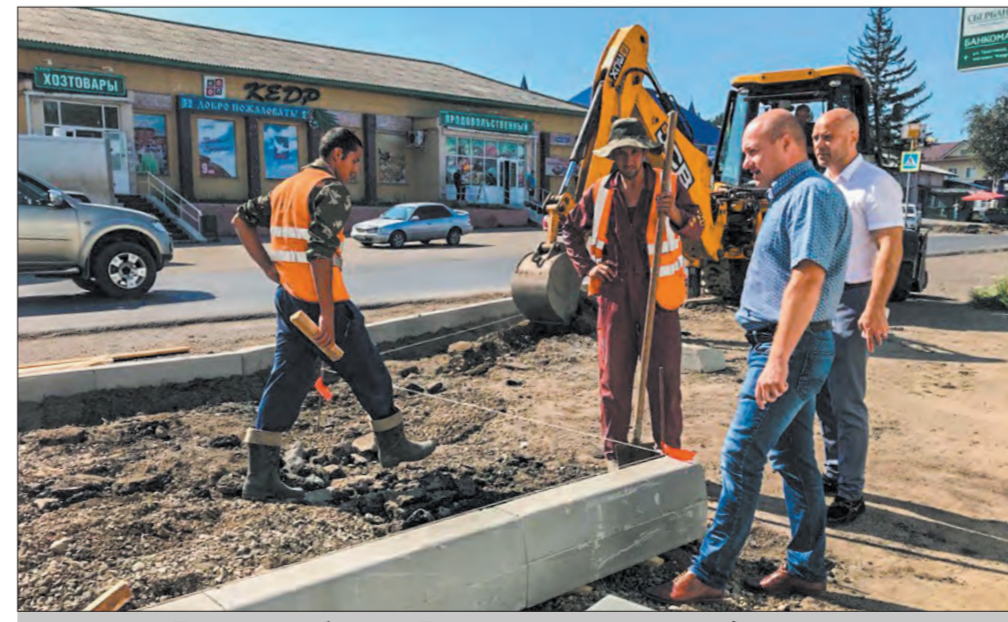
Дорожные работы на Голоустненском тракте под контролем

— Это очень крупный и важный для нас проект. Земельный участок под строительство уже передан в муниципальную собственность. Площадью учреждения составит порядка 6000 квадратных метров, оно сможет принять до 650 человек ежедневно. До 1 августа планируем подать заявку на участие в государственной программе, — заявил глава.