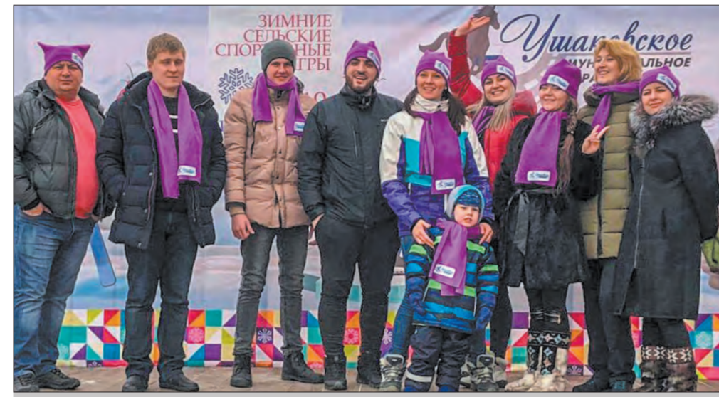
Команда Ушаковского МО на открытии зимних сельских спортивных игр в Пивоварихе

улиц оставались без освещения на протяжении нескольких десятилетий. Так, улица Дачная в Патронах с советских времён не имела освещения, а в Худякова улица Евсеевская — с момента образования деревни (с 1823 года). Сейчас они, наконец, приведены в порядок. Объект будет работать круглогодично: все желающие смогут поиграть в хоккей, мини-футбол, волейбол, баскетбол. Открытие запланировано на это лето.