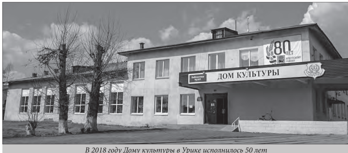
В 2018 году Дому культуры в Урике исполнилось 50 лет

Итоги конкурса подвело Министерство культуры и архивов Иркутской области. Более 130 заявок для участия подали различные муниципальные образования региона. Победителей отбирали по нескольким направлениям. Среди организаций определяли шесть «Лучших муниципальных культурно-досуговых учреждений», три «Лучшие муниципальных общедоступные библиотеки» и один «Лучший муниципальный музей». Приятно, что из десяти победителей два приза забрал Иркутский район. Обе награды