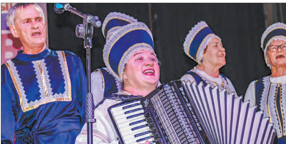
На сцене хор «Смоляночка»

Организаторами конкурса выступили Иркутские региональные отделения «Единой России», «Союза пенсионеров России», организация развития гражданского общества «Клуб «Губерния» при содействии отделения Пенсионного фонда РФ по Иркутской области, администрации и Думы Иркутского района.