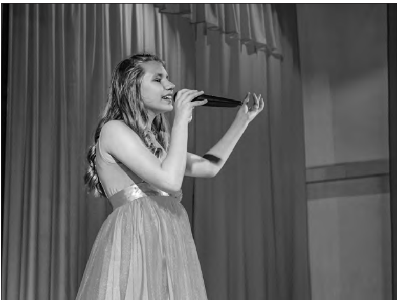
На «Байкальской волне» душа поёт

Среди главных событий уходящего года — второй районный конкурс на лучший творческий отчёт среди муниципальных учреждений культуры. Из 16 участников жюри