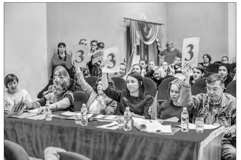
Когда жюри единодушно