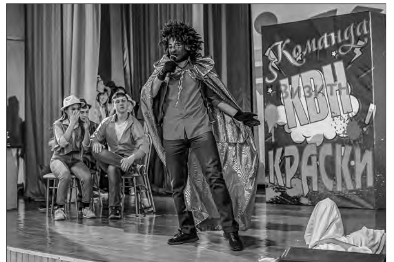
Вошёл в роль, выйду только на награждение