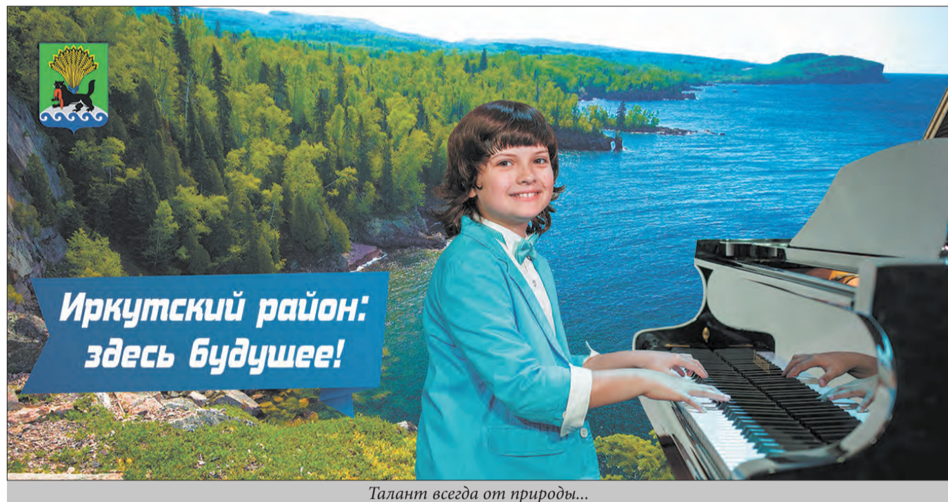
Талант всегда от природы...