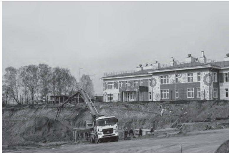
Новый детский сад в Луговом, а школа рядом скоро будет