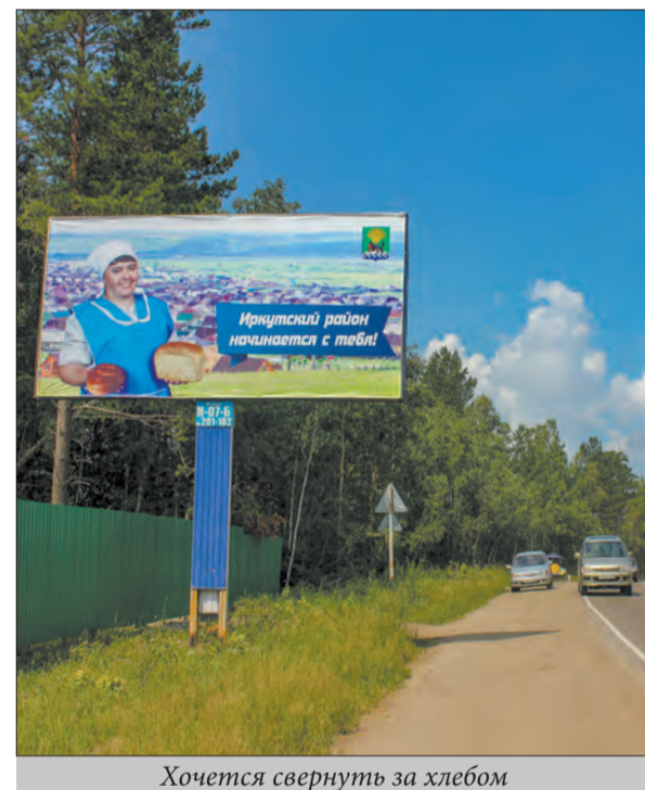
Хочется свернуть за хлебом