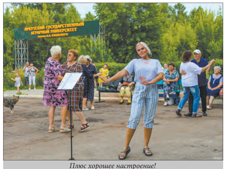
Плюс хорошее настроение!