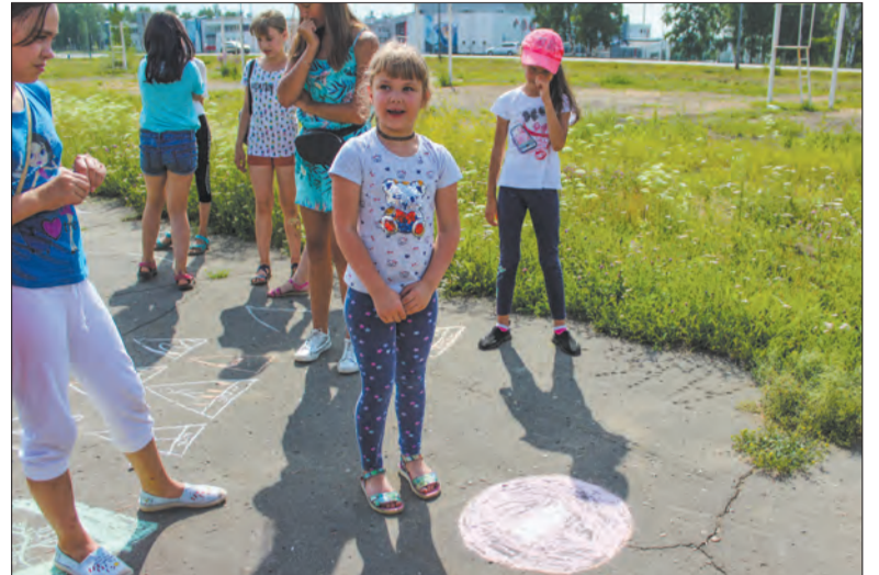
Асфальт — место для творчества

Праздник «Говорим здоровью — да!» прошёл на спортплощадке учхоза «Молодёжное». Дети разделились на команды «Патриоты» и «Дружба» и активно участвовали в спортивных состязаниях и занимательных викторинах.